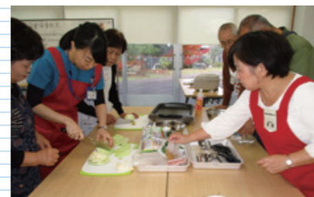
介護予防(食楽食膳)