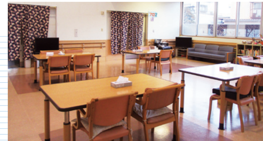
デイサービスルーム