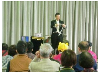
スーパーマジックショー