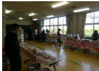
市内8事業所さんの製品販売