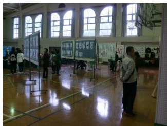
定期講座作品展示