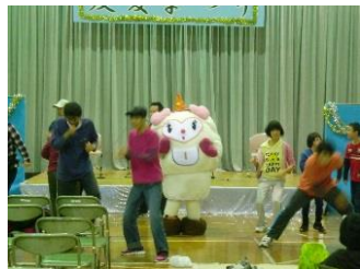
あいちゃんと一緒にダンス！

今年も同じ時期にさらにパワーアップした友愛まつりを開催予定です。今年はお越しいただけなかったかたもぜひ次回の「友愛まつり」でお会いしましょう。