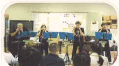
ハーモニカの楽しい演奏会