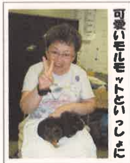
可愛らしいお猫ちゃん