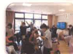
車いすダンス(活動)