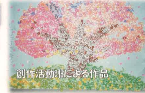
創作活動班による作品