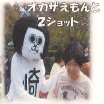
オカザえもんど2ショット