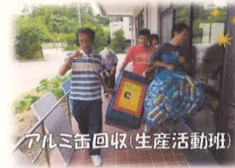
アルミ缶回収(生産活動班)