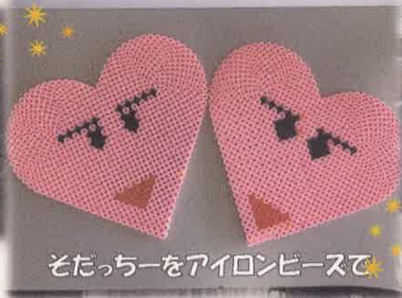
そだちーをアイロンビースで