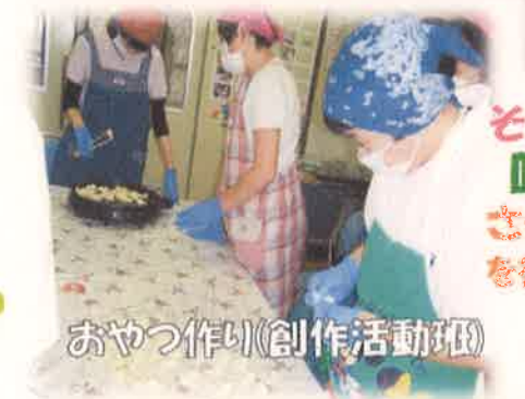
おやつ作り(創作活動班)