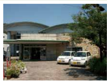
中央地域福祉センター玄関