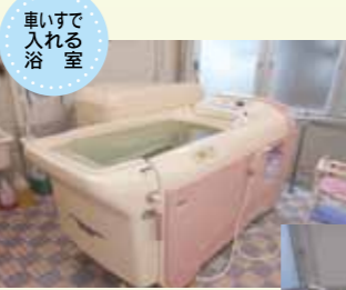
車いすで入れる浴室