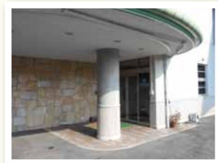
デイサービス玄関