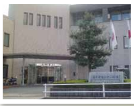
高年者センター岡崎玄関