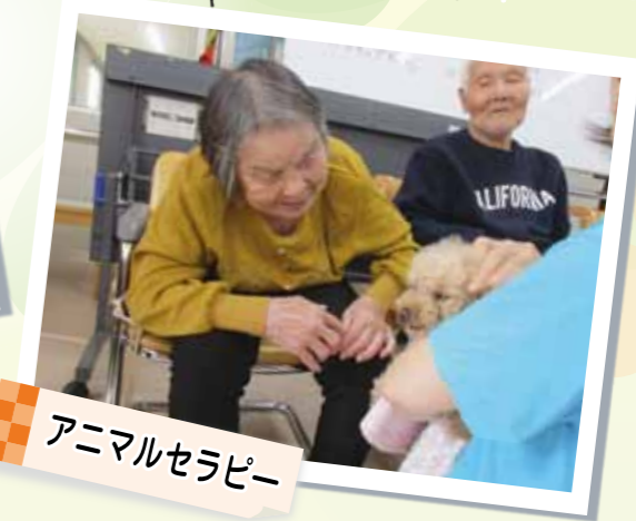
アニマルセラピー