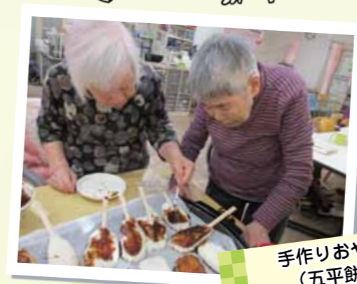
手作りおやつ (五平餅)