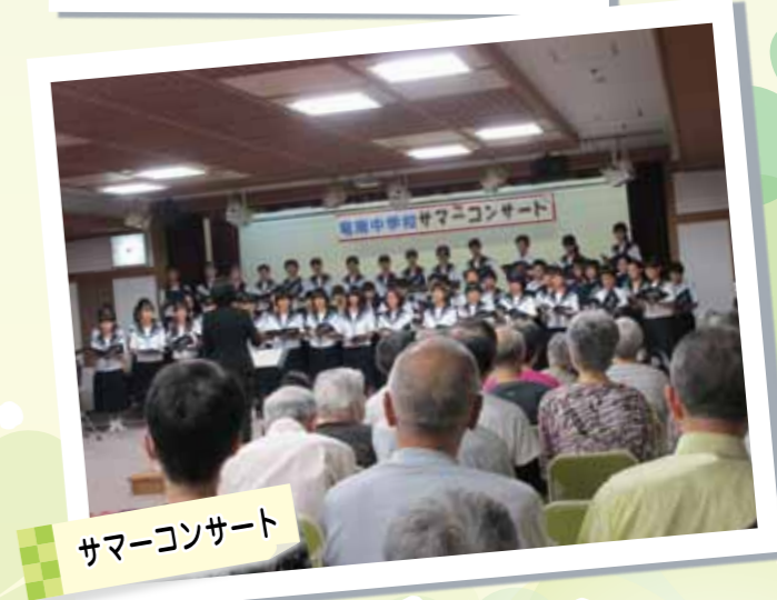
サマーコンサート