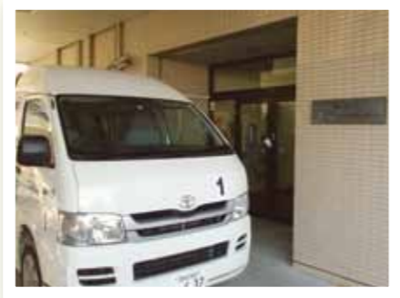
デイサービス玄関