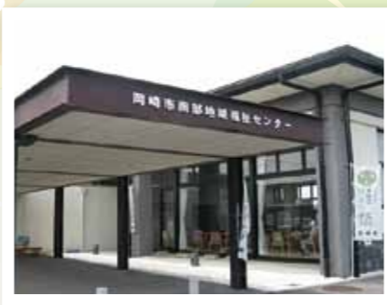
南部地域福祉センター玄関