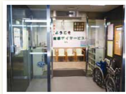
デイサービス玄関