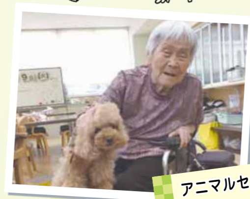
アニマルセラピー