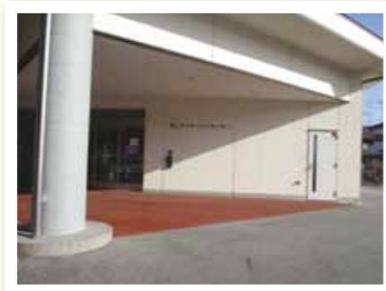
デイサービス玄関