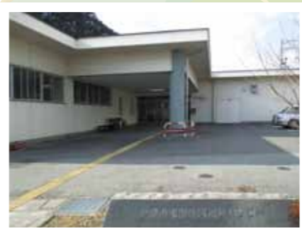
東部地域福祉センター玄関