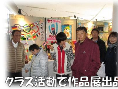
クラス活動で作品展出品