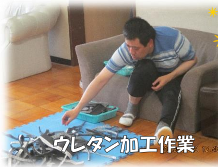
ウレタン加工作業