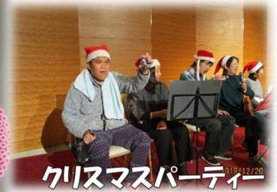
クリスマスパーティー