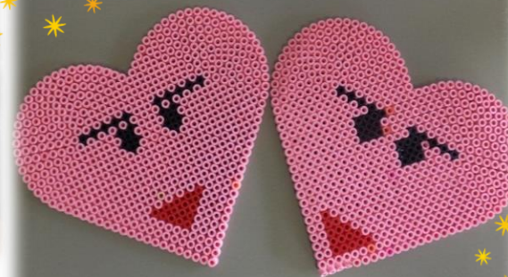
そだちをアイロンビーズで