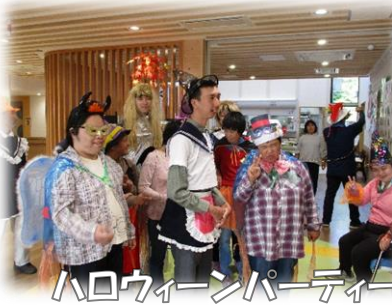
ハロウィンパーティー