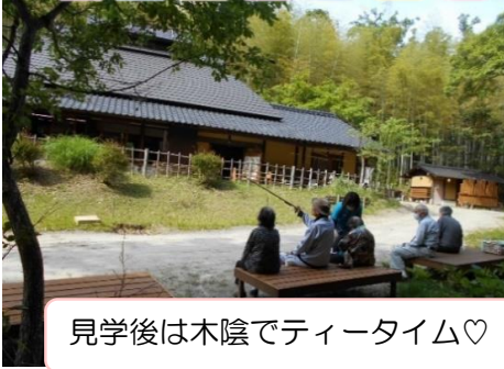
見学後は木陰でティータイム♡