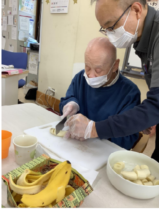
バナナを包丁を使い、きれいに切って準備しました!

3月4日(水)にデイサービスほのぼのにおいて、ほのぼのカフェを開催しました。みんなで協力してチョコバナナ餅を作り、ご利用者様やご家族様とおいしく召し上がって頂きました。皆で普段の生活に関するお話しをしながら、楽しいカフェタイムのひとつときを味わって頂く事が出来ました。