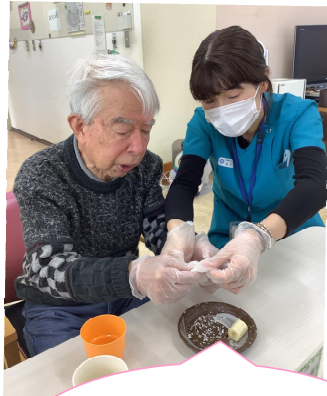
お餅の生地にバナナとチョコレートをのせて、包み込み、形を整えます!