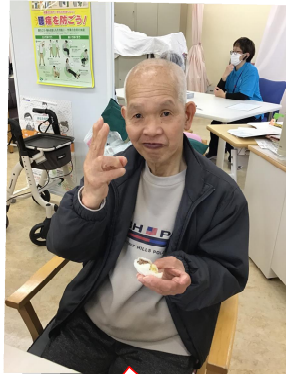
手作りしたお餅はとて美味しい!思わずピースサイン♪