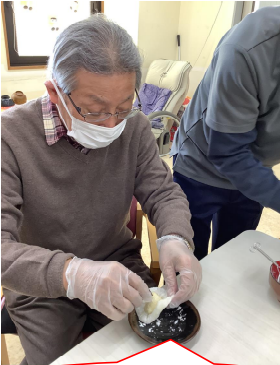
お餅の生地を手で伸ばしてきれいに包める様に工夫します。