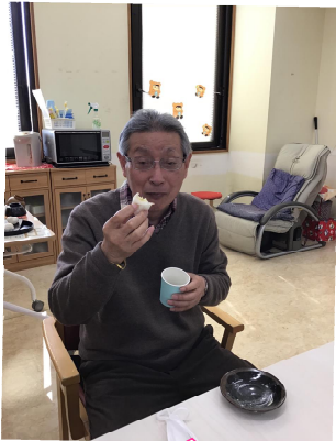
やわらかなお餅の食感とチョコバナナの味が美味しかったね♪