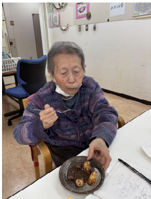
みんなで作ったチョコバナナがおいしくて沢山食べてしまいますね!