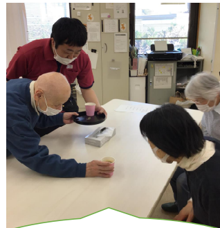
来られたご家族様にドリンクを出しておもてなし♪ごゆっくり♡