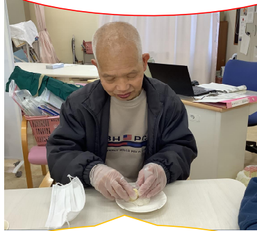
みんなに美味しいお餅を食べてほしいから集中して頑張りますよ!