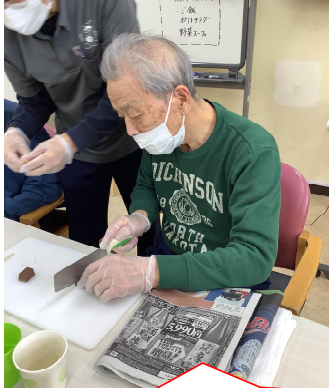
チョコレートは固くて切りにくいけど、手先に集中して、きれいに切り分けることが出来ました♪